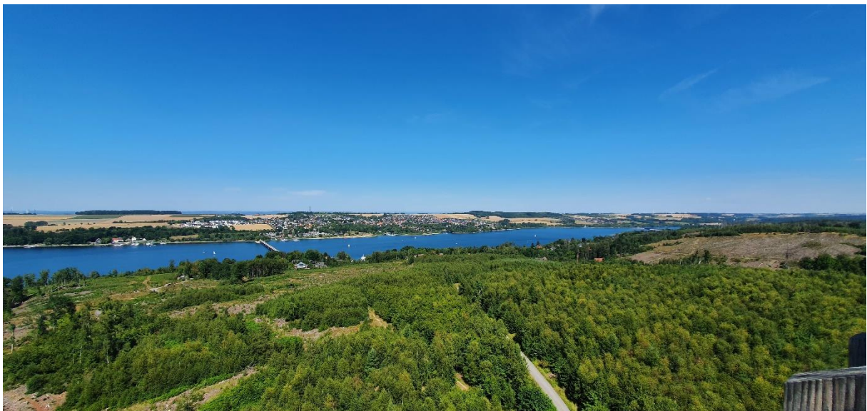
Blick vom Möhneseeturm auf den Möhnesee

Rundwanderung Oberkirchen, in der Mittellein, Vorwald, Oberkirchen, Treffpunkt Kohlmarkt, 9 Uhr. Der Termin wird über die Tagespresse bekanntgegeben.