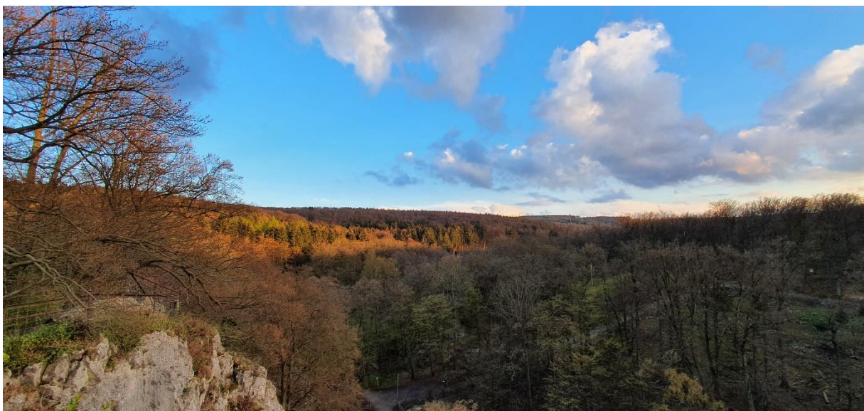
Blick über das Bilsteintal

“Wandern ist die vollkommenste Art der Fortbewegung, wenn man das wahre Leben entdecken will. Es ist der Weg in die Freiheit.” (Elizabeth von Arnim, Schriftstellerin)