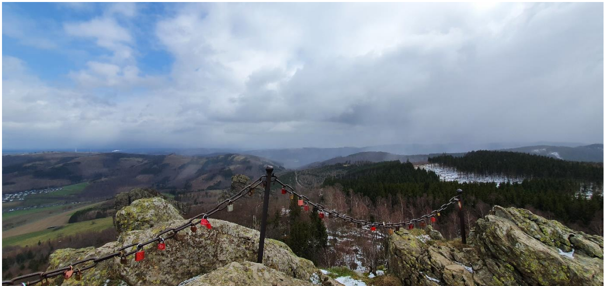
Blick von den Bruchhauser Steinen

23.04.2023 – Tageswanderung, Beginn 10:30 Uhr, Treffpunkt Plückers Hoff – Themenrundwanderung Lörmecketal und Weitsicht vom Lörmecke-Turm, Dauer 5,0 Std, ~12km, Anforderung: leichte Wanderung, Wanderleitung Elena Uther